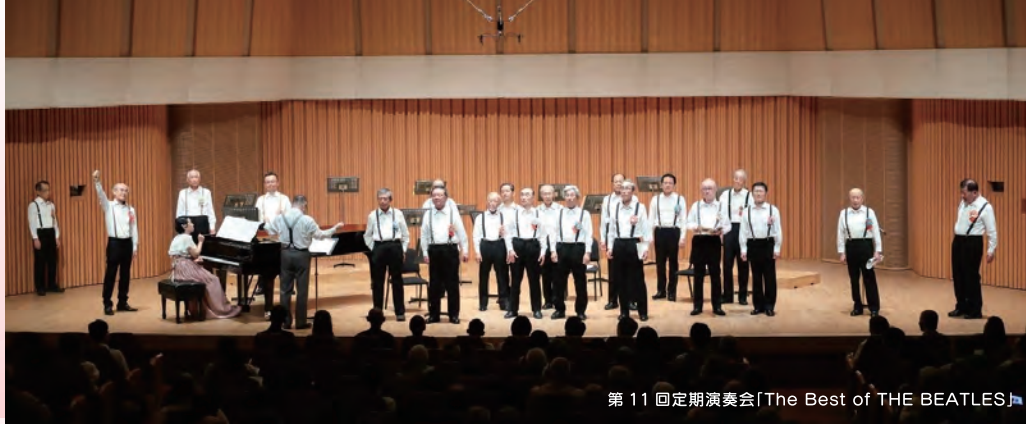
第 11 回定期演奏会「The Best of THE BEATLES」